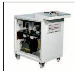
Siet Bombarding System